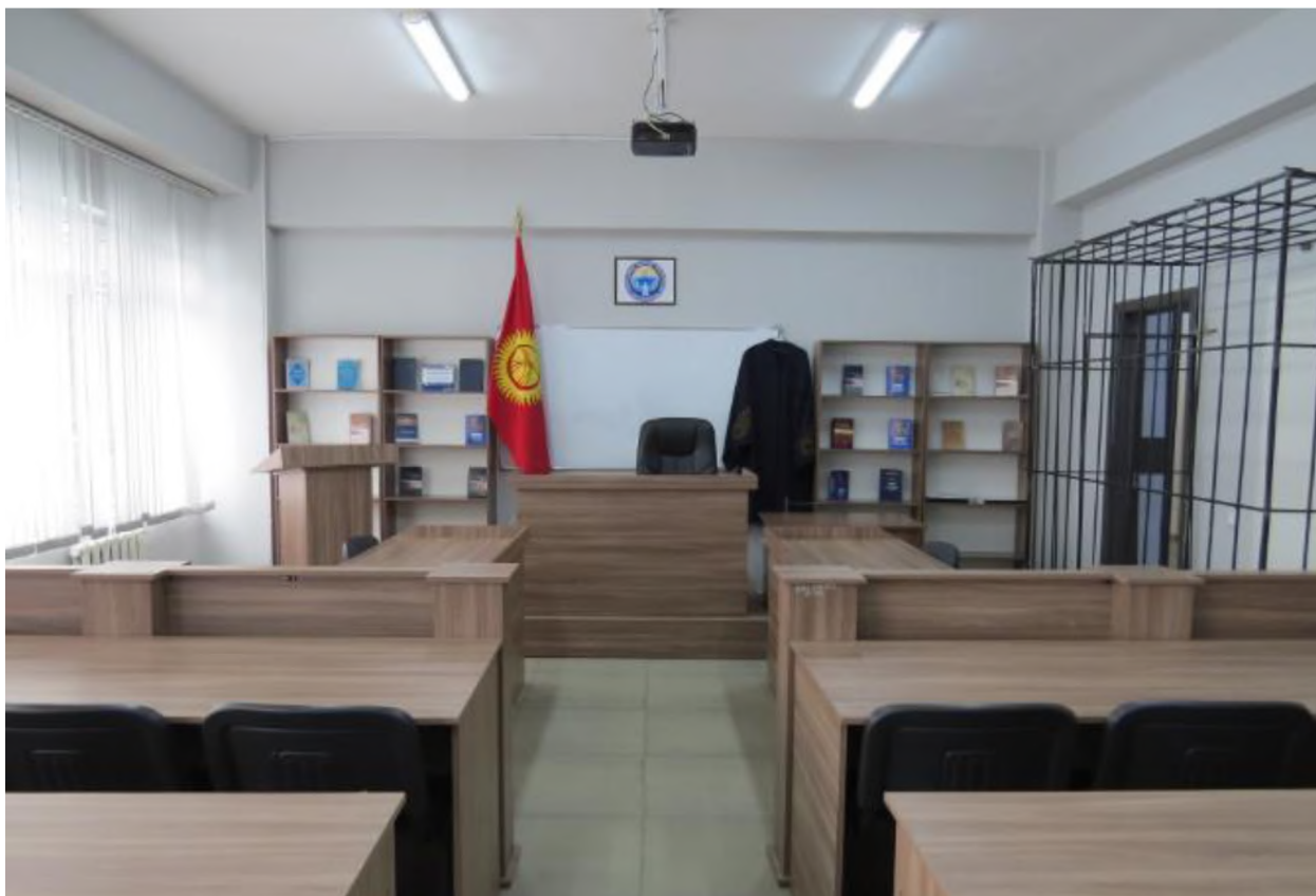
Фото описание специализированной аудитории «Зал судебных заседаний»

Контроль за надлежащим использованием учебной аудитории «Зал судебных заседаний» возлагается на проректора по учебной работе.